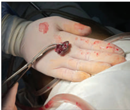
Рис. 3. Видалене стороннє тіло (металевий осколок)

Операції: торакоцентез, дренажування правої плевральної порожнини за Бюлау; ПХО вогнепальної рани.