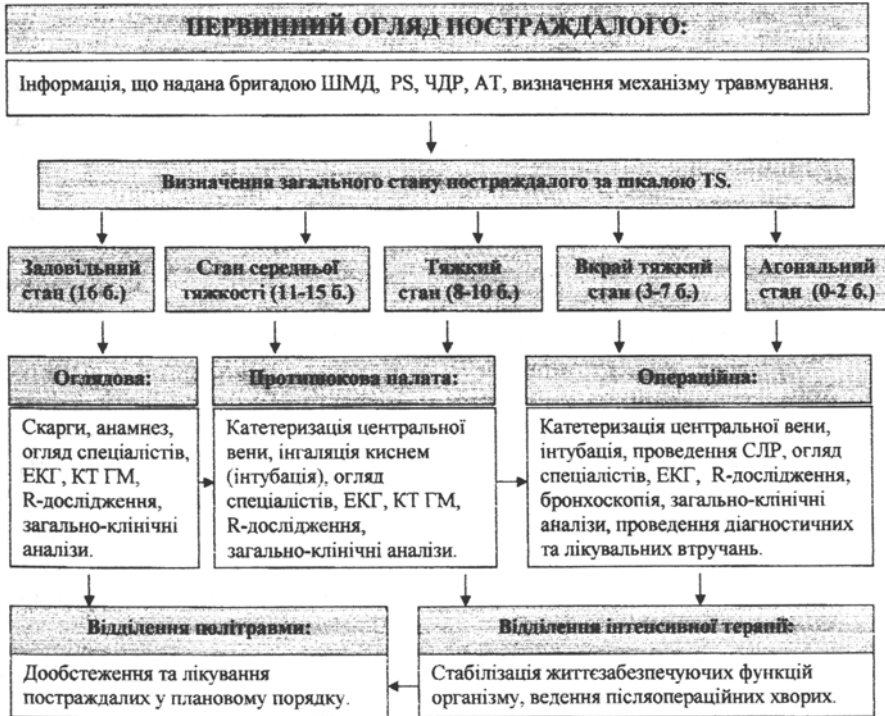
Схема прийняття клініко-організаційних рішень при наданні медичної допомоги постраждалим літнього віку на госпітальному етапі

Аналіз довів, що серед загального масиву дослідження 62,02% постраждалих госпіталізувались в шоковому стані, у 30,66% - спостерігалось порушення свідомості, а 17,52% постраждалих на час госпіталізації знаходились в стані алкогольного сп'яніння. Крім того, на діагностичний процес впливає наявність у постраждалих літнього віку інволюційних та хронічних хвороб. Все це значно ускладнює діагностичний процес у постраждалих цієї вікової групи та потребує від лікарів особливої уваги до травмованих.