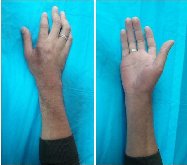
Рис. 2. Зовнішній вигляд правої кисті при пошкодженні n.medianus та n.radialis