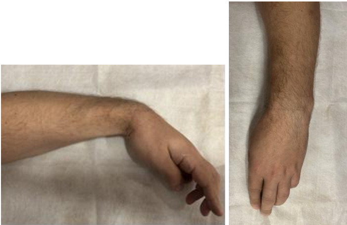
Рис. 3. Зовнішній вигляд лівої кисті при пошкодженні n.ulnaris та n.radialis

Так, при комбінованому пошкодженні n.medianus і n.ulnaris та збереженому n.radialis зберігається іннервація м'язів - m. brachio-radialis , m. anconeus , m. extensor carpi radialis longus , m. extensor carpi radialis brevis , m. extensor carpi ulnaris , m. extensor digitorum , m. extensor