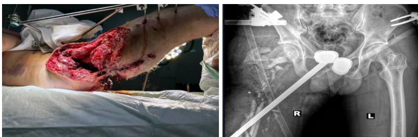
Рис. 1. Видяд рани та рентгенологічна картина на початкових етапах лікування.

Метою роботи є представлення клінічного випадку збереження нижньої кінцівки у пацієнта з тяжким мінно-вибуховим ураженням правого стегна, ускладненим критичним дефектом стегнової кістки, обширною втратою м'яких тканин та розвитком інфекційного процесу. Особливу увагу приділено аналізу поетапного хірургічного підходу, що включав багаторазові некректомії, використання VAC-терапії та встановлення індивідуального пацієнтспецифічного артикулюючого спейсера з інтрамедулярною фіксацією, як альтернативи ампутації у гострому періоді бойової травми.