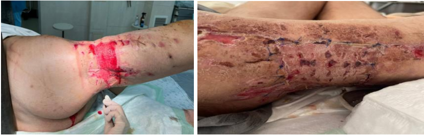
Рис 4. Зовнішній вигляд рани на фінальних етапах та вигляд рани після аутодермопластики.

Впродовж усього лікування пацієнту проводилась: