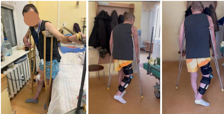
Рис. 5. Вертикалізація пацієнта на 30 добу після поранення.

Інші автори також відзначають ефективність індивідуальних імплантів у тяжких травмах, однак у літературі переважають приклади використання 3D-друку в планових умовах (наприклад, при ревізійному ендопротезуванні) [6, 7]. У даному випадку імплант створювався в умовах гострої травми, що додає йому додаткової цінності як клінічному рішення.