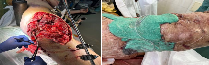
Рис. 2. хірургічні обробки інфікованих ран із тотальною некректомією нежиттєздатних тканин, встановленням VAC-системи

14–19.02.2025 – поетапні хірургічні обробки інфікованих ран із тотальною некректомією нежиттєздатних тканин, встановленням VAC-системи (відкрита система з герметичним покриттям, негативним тиском –125 мм рт. ст.).