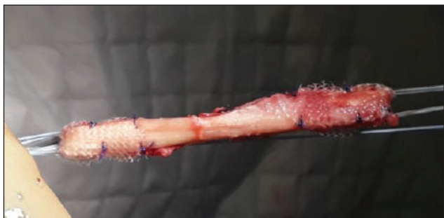
Рис. 1. Підготовлений трансплантат із сухожилка напівсухожилкового м'яза, на кінцях якого зафіксовано поліпропіленову сітку

Результати оцінювання больового синдрому за ВАШ на 2 і 3-тю добу, через 1, 3 і 6 тижнів після операції показали, що істотних відмінностей між групами немає, але всередині кожної групи вони