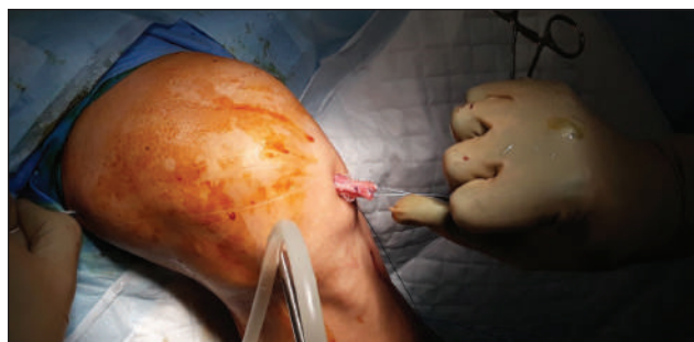
Рис. 3. Приклад уведення трансплантата в підготовлені канали

Аналіз результатів показав, що терміни купірування синовіту корелювали з повним навантаженням на кінцівку (коефіцієнт кореляції 0,69) і досягненням згинання в коліні 90° (коефіцієнт кореляції 0,57).