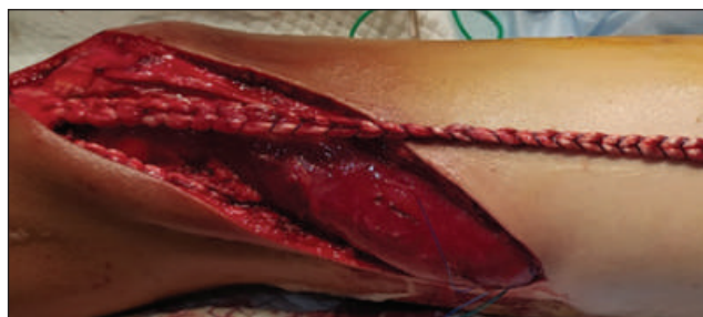
Рис. 2. Зовнішній вигляд сформованої автозв'язки

f — 24. Критичне значення t -критерію Стьюдента за цієї кількості ступенів свободи складає 2,064.